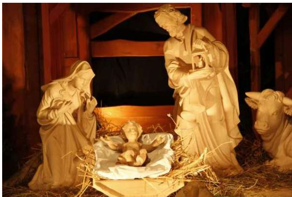
Krippe in St. Clemens 2013/2014

Kontakt: Propstei: Tel 0511 16405-30 - FAX 16405-52 - E-Mail: c.schmidt@kath-kirche-hannover.de